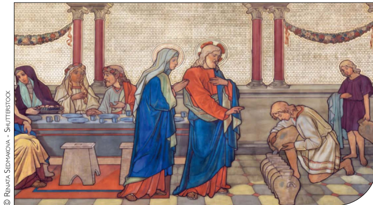
Les noces de Cana.

Espace protestant Théodore-Monod 22, rue Romain-Rolland 69120 Vaulx-en-Velin Tél. 04 78 54 88 26