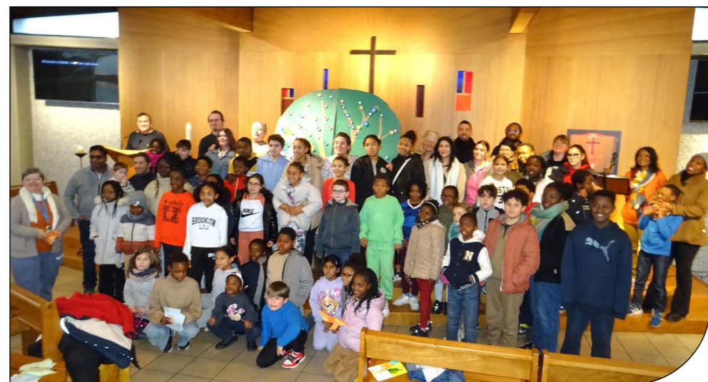
Journée annuelle œcuménique des enfants (catholiques et protestants) à Saint-Fons (le 1 er février)