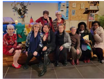
Le groupe œcuménique à l'initiative de la Journée mondiale de la Prière

Outre les échanges de chaire lors de la Semaine de l'Unité en janvier, depuis 13 années déjà, nous célébrons la Journée mondiale de prière (JMP) en mars avec nos sœurs et frères de la paroisse catholique Saint-Thomas de Vaulx-en-Velin. Depuis lors, se sont jointes à nous la paroisse de l'Épiphanie de Vénissieux et l'Église adventiste.